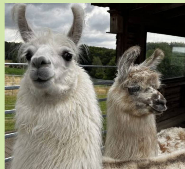
„Gigant“ (l) und „Kleiner Donner“ betrachten neugierig ihr neues Zuhause in Ostercappeln.