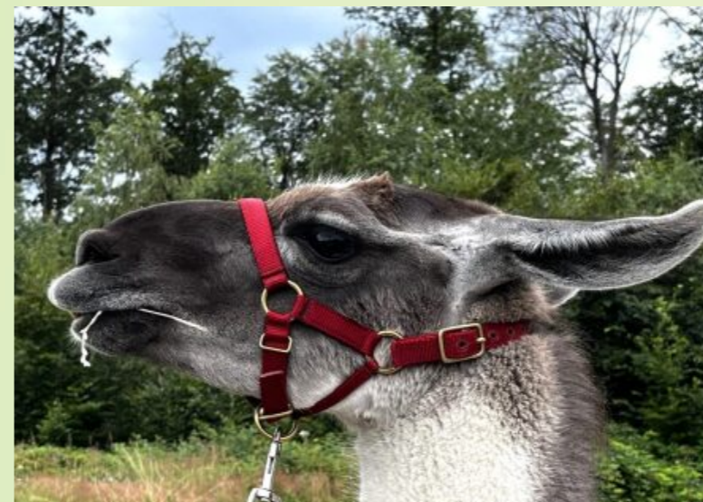
Sanft und respektvoll schaut das Lama bei den Wanderungen auf den führenden Menschen hinunter.