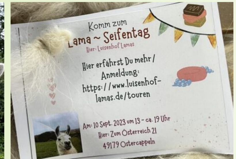
Spannende Stunden mit interessanten Erkenntnissen verspricht der Seifenworkshop auf dem Luisenhof. Denn die Wolle liefert viele Zutaten dafür.