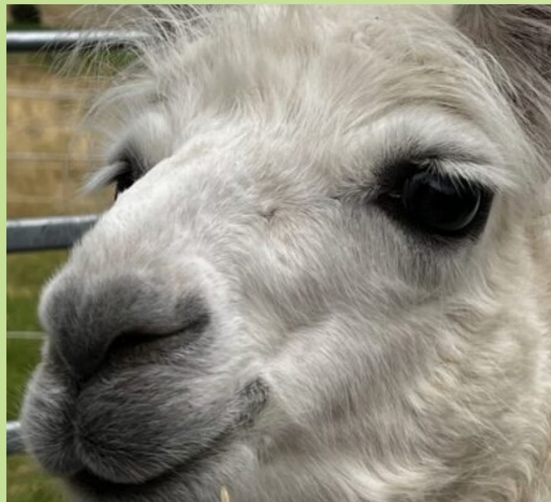
„Gigant“ ist eines der beiden neuen Lamas die auf dem Luisenhof Ostercappeln wohnen.

Picknicktouren mit den Lamas durch das Wiehengebirge / „Seifentag“ am 10. September