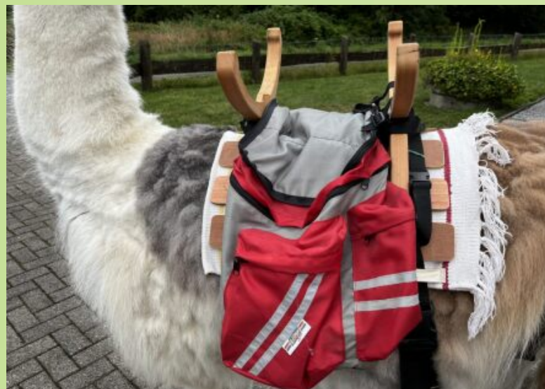
Auf dem Packsattel transport das Lama den Proviant für eine Trekkingtour.